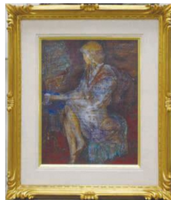
【優秀賞】小島良治 洋画 物想い

西区イベント推進会議事務局(区企画振興課内) ☎895-7033 ファ885-0467