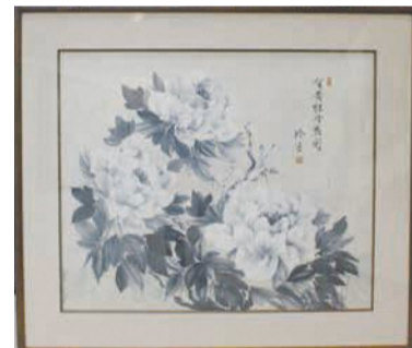
【優秀賞】淀川玲子 日本画 牡丹