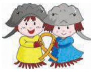
西区子育て応援キャラクターカブーとガニー

子育て世帯が楽しめるイベントを行います。また、子育てを応援してくれる人も募集しています。