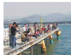
昭和バス西浦線でも行けます。「海釣公園前」下車すぐ

皆さん、福岡市海づり公園で、手ぶらで魚釣り体験ができることをご存じですか。ここでは、釣道具やえさを用意する必要がなくなり、海鮮グルメプランもできる「豪快な真鯛釣り」が人気です。3月22日(日)まで、釣ったマダイを刺身とあら炊きにし、唐泊り小屋で食べることもできます。「海釣公園前」下車すぐ。初心者から上級者まで気軽に魚釣りを楽しめます。釣り指導を受けることもできます。このほか、グループで参加できる釣り大会などのイベントも開催されています。3月22日(日)まで、釣ったマダイを刺身とあら炊きにし、唐泊り小屋で食べることもできます。「海釣公園前」下車すぐ。釣り指導を受けることもできます。このほか、グループで参加できる釣り大会などのイベントも開催されています。3月22日(日)まで、釣ったマダイを刺身とあら炊きにし、唐泊り小屋で食べることもできます。「海釣公園前」下車すぐ。