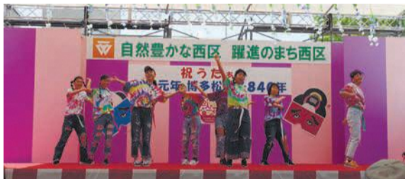
「糸島高校ダンス部RAINBOW'S」によるヒップホップダンス(昨年)

期5月3日(日・祝)、4日(月・祝)午前10時半～午後4時 所西区演舞台(区役所駐車場) 関区内に住むか通勤・通学する人 定抽選で各日15組程度 申区ホームページ、区企画振興課や区内各公民館で配布する申込書に記入し、郵送、ファクスまたはメールで3月23日(月)必着で西区イベント推進会議事務局(〒819-8501住所不要、区企画振興課内 ☎895-7033 ☎885-0467✉shinko.event24@city.fukuoka.lg.jp)へ。