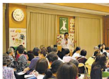
鑑賞後の意見交換