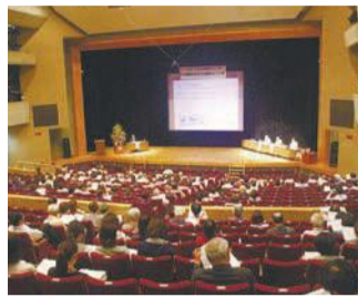
地区ごとに取り組みを報告

8月25日(日)午後1時～3時半 九州大学伊都キャンパス 区内に住む小学4～6年生 抽選で30人(保護者は1人まで同伴可) 無料 申込みはがき、ファクスまたはメールに、「びっくり子ども科学実験教室」、住所、参加者全員の氏名(ふりがな)、学年、電話番号、同伴する保護者氏名を書いて、8月1日(木)必着で、区企画振興課(〒819-8501住所不要 ☎895-7006 ☎885-0467 ✉shinko.event24@city.fukuoka.lg.jp)へ。結果は8月9日(金)までに発送します。