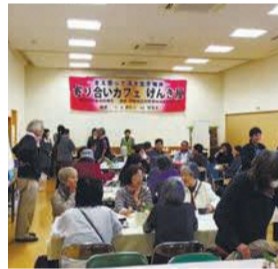
いつも笑顔があふれているカフェ

石丸校区大町団地自治会では、ロコモティブシンドローム(老化に伴う筋力低下)予防のための運動サロンを月3回開催。休憩をとりながら自分のペースで運動します。「楽しく参加しやすい場づくりを心掛けてい