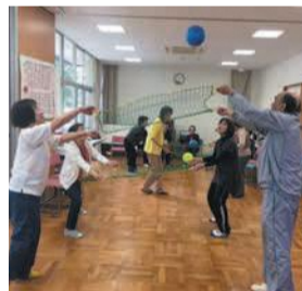
みんなでレクリエーション

人生100年時代に向けた備えを、あなたの地域であなただが主役となって考えてみませんか。 [問い合わせ先] 区地域保健福祉課 ☎895-7077 ☎891-9894