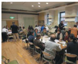
意見交換に熱が入ります

区は、住み慣れた地域で暮らし続けられるよう、医療や介護、健康づくり、介護予防、生活支援などのサービスを一体的に提供する仕組み「地域包括ケアシステム」を地域と共働で推進していきます。その一環として、6月18日に西市民センターで「超高齢化を支える西区サミット」が開催され、講演のほか、住民による取り組みが報告されました。