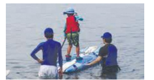
スタンドアップサーフィン