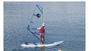
ウインドサーフィン