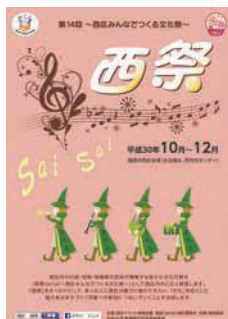
昨年のリーフレット

「西祭(SaiSai)～西区みんなで作る文化祭～」のリーフレットに掲載する、文化行事などの情報を募集します。リーフレットは、区役所や公民館などで配布します。