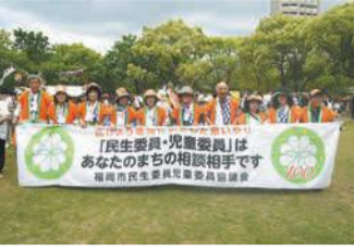
民生委員・児童委員の皆さん

民生委員・児童委員は、地域から推薦され、厚生労働大臣の委嘱を受けたボランティアです。区内では約300人が活動し、福祉や子育てなどの支援を行っています。