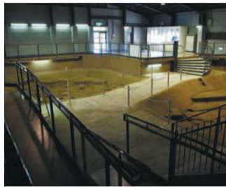
住居跡を間近で見られます

はがき、ファクスまたはメールにイベント名、住所、参加者全員の氏名(ふりがな)、年齢、電話番号を書いて、同事務局(千819-8501住所不要、区企画振興課内 shinko.event24@city.fukuoka.lg.jp)へ。