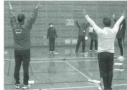
◀◀ 綱引きの審判 ▶▶ 判定の合図の練習です。みんなでボーイング。

競技の審判や指導を行うためには定期的な講習会で技術を身につけることが大切です。早良区親善スポーツ大会で実施している①綱引き、②ビーチボールバレー、③ファミリーバドミントンの3種目について、今年度は親善スポーツ大会は中止になりましたが、コロナ禍に配慮し、体育振興会の実行委員会委員を中心に審判講習会を実施しました。