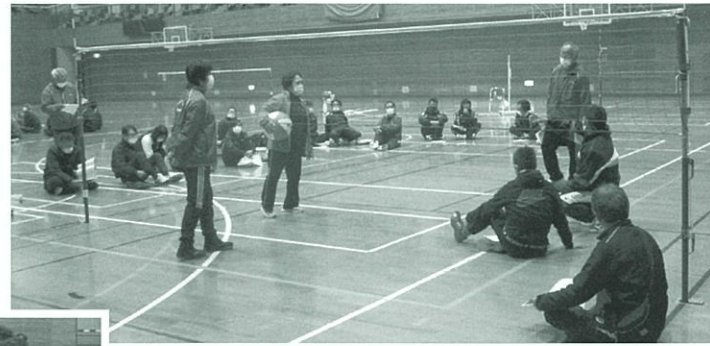
↑↑ ビーチボールバレーの審判 ▶▶ ネット際の迷いやすいジャッジは特に慎重に学習します。