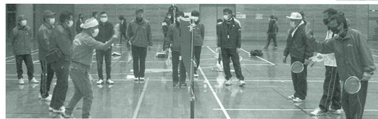
◀◀ ファミリーバドミントンの審判 ▶▶ ライン際のジャッジについて説明を受けた後、ゲームをしながら確認していきました。