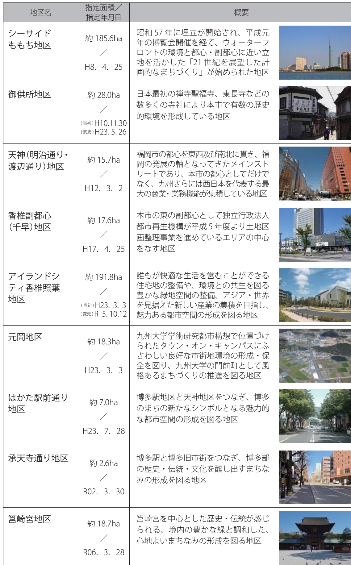
表 1-1 都市景観形成地区