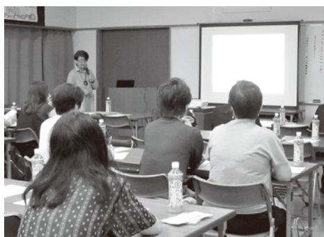
熱心に耳を傾ける参加者

今回参加して、初めてチャイルドラインの存在を知った方も多く、紹介された事例から子どもたちの悩みや生きづらさを実感したとの声を聞きました。また以前に比べて、保護者に対する世間の目が厳しくなっているのでは…と感じる話もありました。子育て世代に地域が協力し、より住みやすい町にするためには何が必要なのか…保護者と地域住民が一体となって考えていくことが、何より重要ではないかと考える良いきっかけになりました。