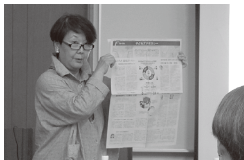
チャイルドラインに寄せられる 子どもの声が紹介されました