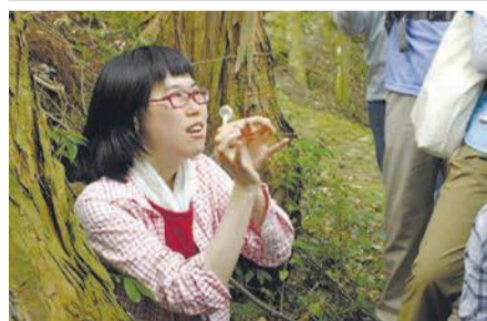
③講師の「きのこちゃん」