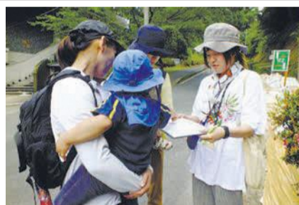
④おやこトコトコさんぽ