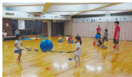
過去の同スクール

競技用車いすなどパラスポーツの道 具を使用したタイムトライアルやゲーム を行います。開5月5日(火・祝)午前10時 ～午後1時(受け付けは午前9時50分か ら) ☎小学生以上 ☎無料 ☎不要