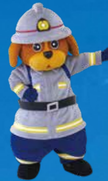
福岡市消防局 マスコットキャラクター ファイ太くん