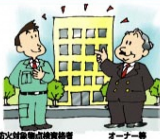
防火対象物点検資格者 オーナー等