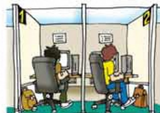
インターネットカフェ