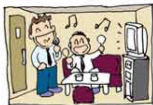
カラオケボックス