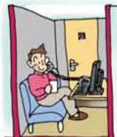
テレフォンクラブ