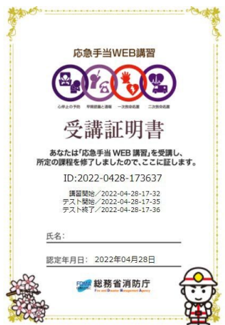
(旧コンテンツ受講証明書)

※令和5年3月まで公開していた 旧コンテンツから発行された 受講証明書と同等の証明書です。