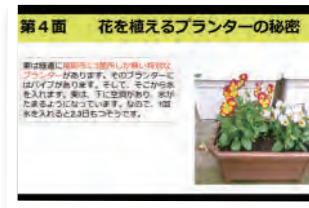
ICTを活用した「デジタル新聞」

百道浜小学校は、ユネスコスクールに認定されており、SDGsの学習に力をいれています。今年度は、全学年がSDGsの取り組みを実施し、特に4年生は、「百道浜環境守り隊」と題し、校区内見学やゲストティーチャーによる出前授業を通して地域環境について学習しました。学習の終末時には、ICTを活用して「デジタル新聞」を作成し、報告会を実施しました。