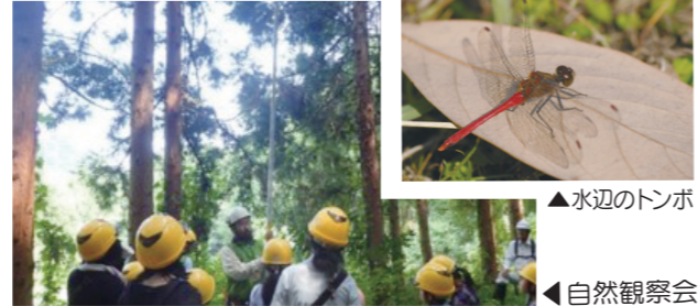
▲水辺のトンボ ▲自然観察会