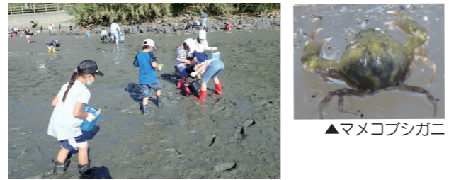
▲生きもの調査(干潟) ▲マメコブシガニ

干潟での生きもの調査や自然観察会など、市民が自然や生きものとふれあい、学習できる場を提供しています。