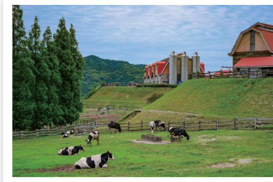
ABURAYAMA FUKUOKA(アブラヤマ フクオカ)