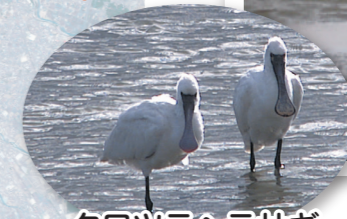
クロツラヘラサギ