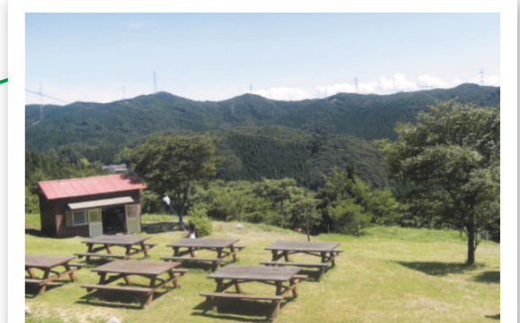
背振少年自然の家