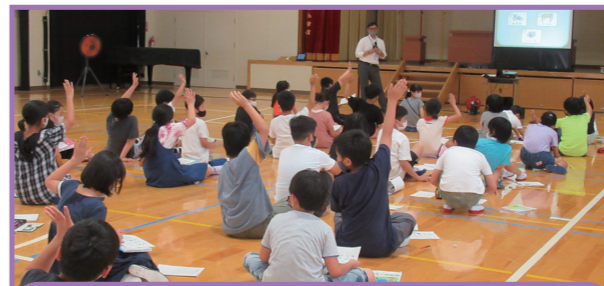
分別方法・リサイクルの説明

小学校を訪問し、家庭でのごみ分別方法、リサイクル品の説明などを行って、ごみの減量やリサイクルの大切さを呼びかけています。見て、ふれて、体験しながら楽しく学びましょう。