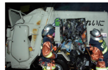
パッカー車の火災

もえないごみの中に、ゲーム機などの充電式電池、なかみを使い切っていないスプレーかんが