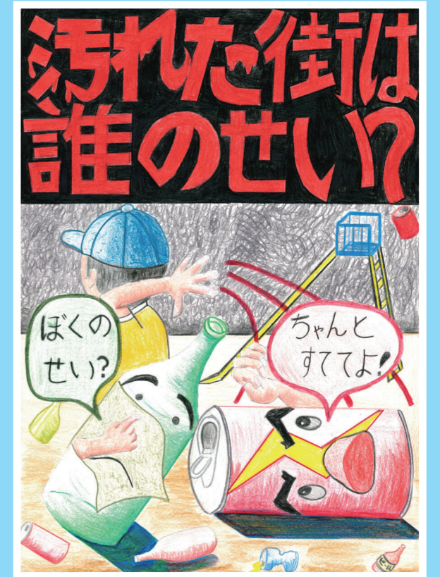
令和5年度「福岡市あき缶・びん対策協会」小・中学生ポスターコンクール最優秀賞受賞作品 (左上:小学生低学年の部、右:小学生高学年の部、左下:中学生の部)