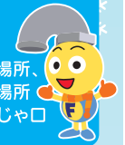
水道局マスコット フクちゃん