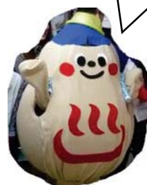
福岡市支部キャラクター 「温まるくん」