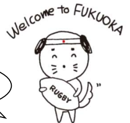
福岡検定公式キャラクター オッペケケン