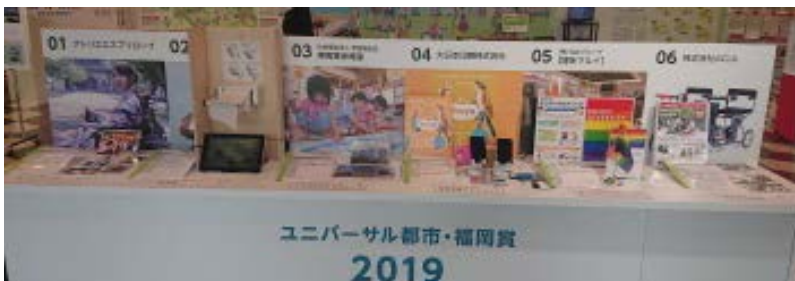
◇ユニバーサル都市・福岡賞 展示ブース (ユニバーサルデザイン見本市内)

ユニバーサルデザインの優れた取組みや製品、アイデア等 11点の候補の中から、審査員による審査や、市民投票によって選出した「最優秀賞」「優秀賞」「アイデア賞」「市民特別賞」の表彰を行います。