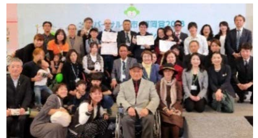
◇昨年の表彰式の様子