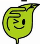
環境シンボルキャラクター エコッパ

福岡市役所の駐車場は混雑が予想されますので、公共交通機関でお越しください。 ※福岡市役所の駐車場を利用される場合は一般利用者料金（30分までごとに200円）となりますのでご注意ください。