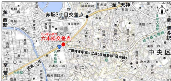
※この地図は、国土地理院発行の地形図を使用したものである。