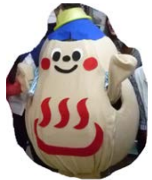
組合福岡市支部 キャラクター 「温まるくん」