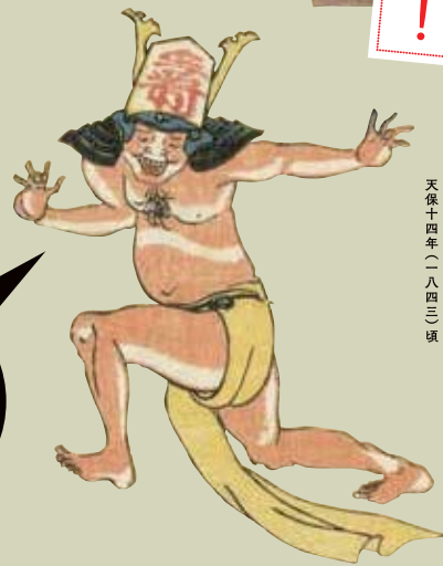
⑧ 歌川国芳 駒くらへ将棋のたはむれ はだか玉将・まてくんねへまたねへ、、、、 (部分) 天保十四年(一八四三)頃