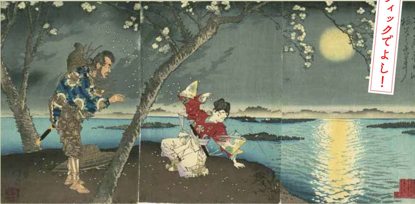
④ 月岡芳年 東名所墨田川梅若之古事 明治十六年(一八八三)