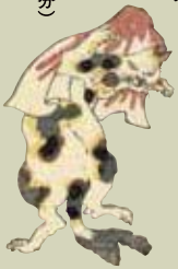
③ 歌川国芳 日本駄右エ門猫之古事(部分) 弘化四年(二八四七)

本展では、名古屋博物館の豊富な浮世絵コレクションから約150点を選び抜き、旺盛な好奇心と柔軟な発想、豊かな表現力によって国芳が切り開いたさまざまな新生面が、どのように弟子たちに継承され、変化していったのかに注目します。なお一部作品には、衝撃的な表現がございます。