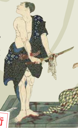
⑦ 月岡芳年 英名二十八衆句 因果小僧六之助(部分) 慶応二年(一八六六)