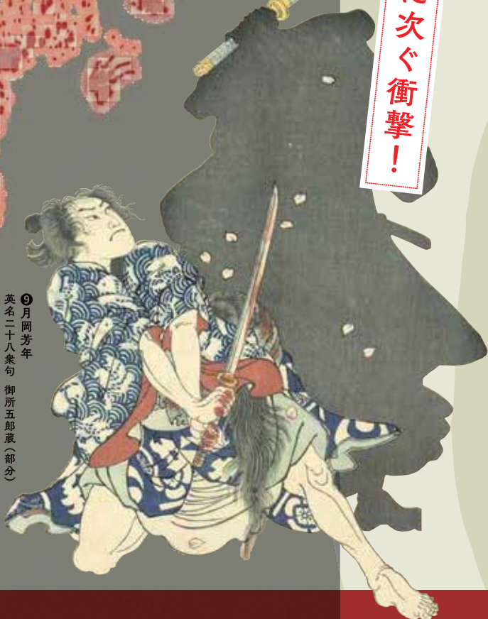
⑨ 月岡芳年 英名二十八衆句 御所五郎蔵(部分) 慶応二年(一八六六)