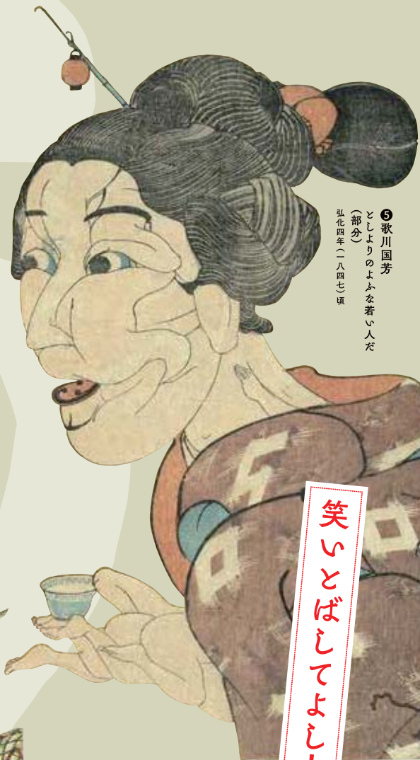
⑤ 歌川国芳 としよりのよふな若い人だ (部分) 弘化四年(一八四七)頃