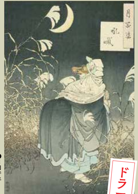
② 月岡芳年 月百姿 吼嘘 明治十九年(一八八六)