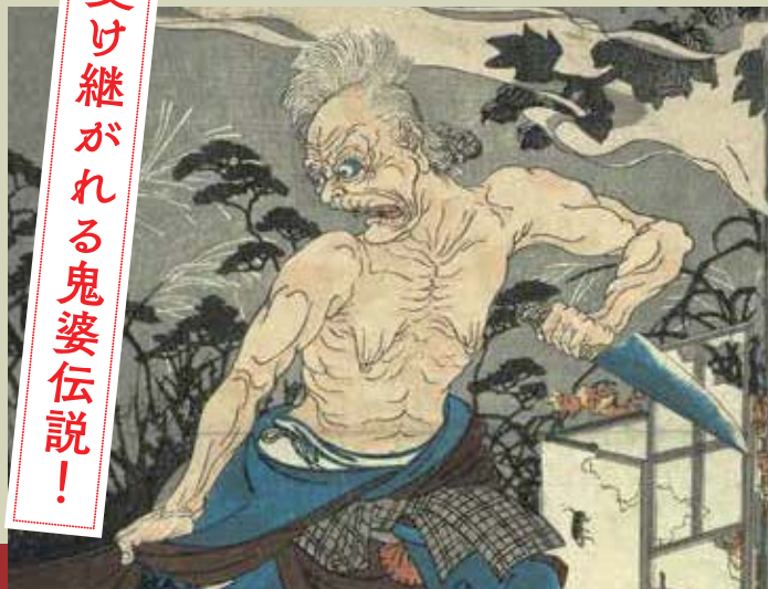
⑩ 歌川国芳 観世音霊験(部分) 天保十三年(一八四二)か