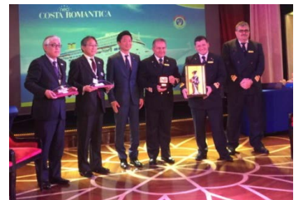
参考：他船の初入港歓迎式典の様子