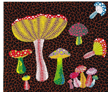
草間彌生 《毒きのこ》 1990年 松本市美術館蔵

レストランコラボメニューはアフタヌーンティーセット！ トランプ型のサブレやフルーツサンドで優雅な時間を。