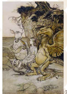
①ジョン・テニエル『鏡の国のアリス』挿絵のための下絵《アリス女王》John Tenniel, "Queen Alice" The Rosenbach, Philadelphia ②チャールズ・ラトウィッジ・ドッドソン 《アリス・リデルの肖像》(複製) ③チャールズ・サントレー 『不思議の国のアリス』第5章より《イモ虫からの忠告》 ④草間彌生《毒きのこ》1990年 ⑤エリック・カール《チェシャネコいもむし》"Cheshire CAT-erpillar" created by Eric Carle, 2018. ⑥清川あさみ《涙の池》 ⑦アーサー・ラッカム《ニセウミガメ》