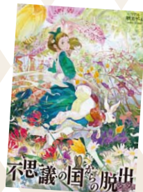
Illustration by SHINOMIYA YOSHITOSHI ©SCRAP

全世界で550万人を動員する「リアル脱出ゲーム」とコラボレーションが実現! 専用のキットを使って次々と現れる謎を解き明かし、『不思議の国』から脱出しよう! ◆専用キット 1,500円(税込)/別途、展覧会観覧券が必要です。 ◆販売時間 9:30~15:00 ◆混雑時には販売を制限する場合がございます。ご了承ください。