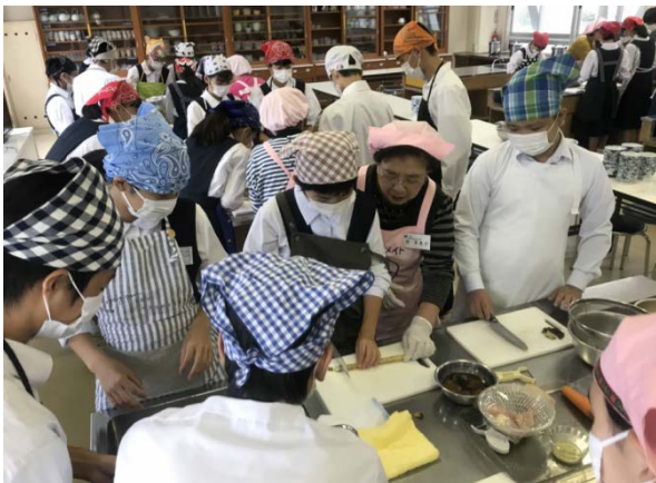
〈前回の調理実習の様子〉