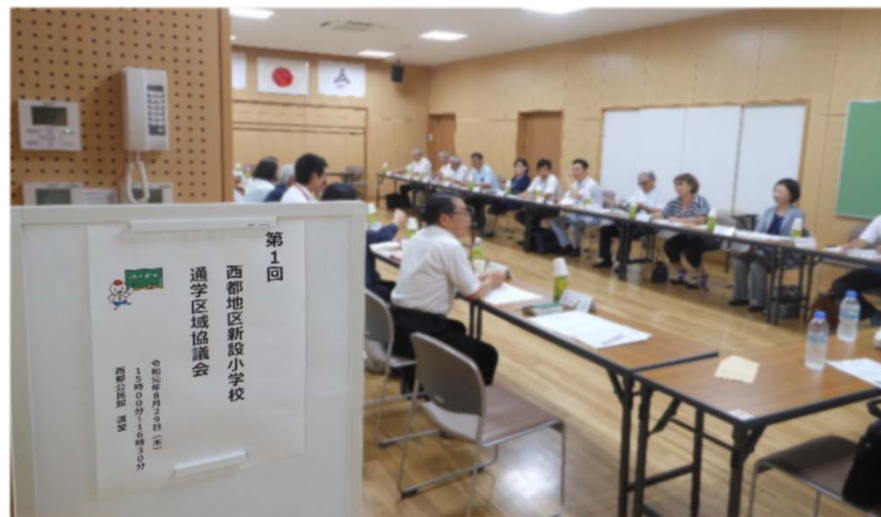
<第1回協議会の様子>

第2回協議会は、令和元年9月25日（水）16時から、西都公民館にて開催し、具体的な通学区域案の協議・検討を行います。詳細は次号の『協議会ニュース』でお知らせします。