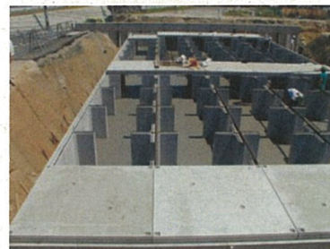
プレキャスト雨水貯留施設