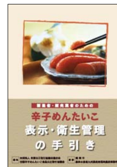
辛子めんたいこ 表示・衛生管理の手引き

食の安全安心を確保する上で、食品事業者の自主的衛生管理の向上を積極的に推進している業界団体の役割は重要である。このため、業界団体への情報提供や研修会の開催などにより、その活動を側面から支援する。また、福岡（博多）の特産品である辛子めんたいこの自主的衛生管理の推進のため、業界団体（全国辛子めんたいこ食品公正取引協議会）と協働して適正表示や衛生管理に取り組む。