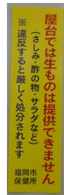
屋台での生もの提供禁止ステッカー

「福岡市食品衛生条例」に定められた屋台営業者に関する規定が確実に遵守されるよう屋台の監視指導を定期的を実施するとともに、「福岡市屋台指導要綱」に基づき、関係部局との連携のもと、施設への監視指導や屋台営業者向け講習会を行い、屋台営業の適正化を図る。