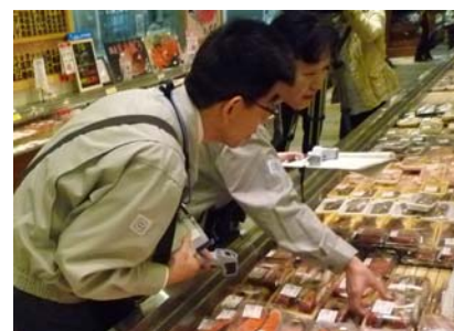
年末食品一斉監視

また、ノロウイルスやフグ毒による食中毒防止対策、市場衛生対策等の監視指導を重点的に実施する。