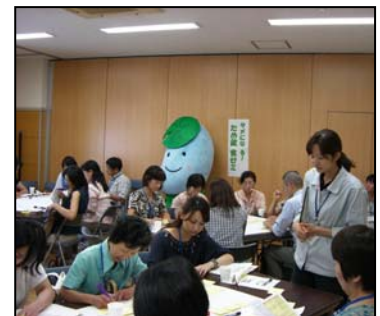
食の安全安心に関する勉強会

また、市民等の求めに応じ、地域・団体等の集会に出向く出前講座（くらしのステップアップセミナー）を開催し、食中毒予防や食品表示などに関する情報提供や食に関する意見交換を実施する。