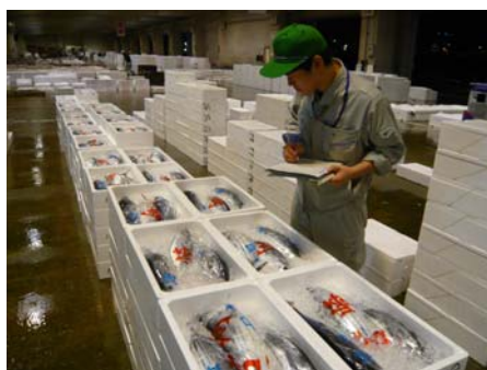
鮮魚市場内の監視

せり売り開始前の夜間監視や早朝監視において，有毒・有害魚介類の排除，適正な温度管理，青果物の衛生的な取扱い，適正な表示等の確保のため，定期的に監視指導及び収去検査を行い，市場外への不良・違反食品の流通を防止する。また，仲卸店舗や関連施設での食品の取扱い，保管状況及び適正な表示について監視指導を行う。