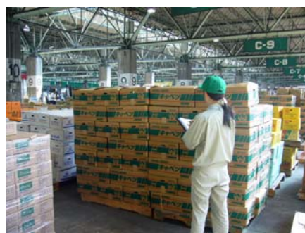
青果市場内の監視