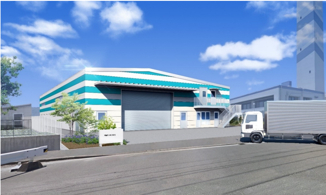
積替保管施設 設置場所