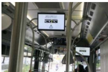
バス車内 ビジョン