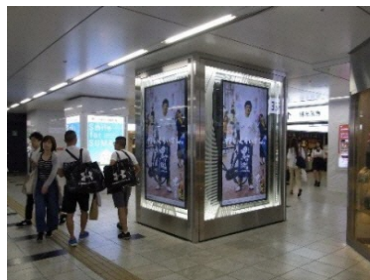
主要駅構内 デジタルサイネージ