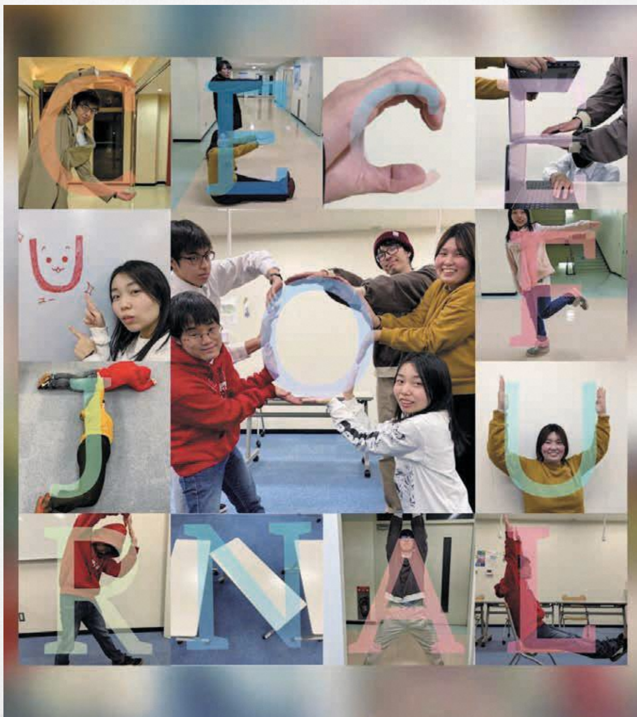
福岡市明るい選挙推進グループCECEUF(セセウフ)～福岡市有志大学生による明るい選挙啓発活動～

セセウフ通信第7号 若者からつくる日本の未来 Every youth is a creator of the future.