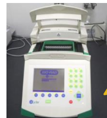
サーマルサイクラー