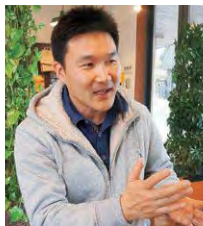
ボランティアとして活動した