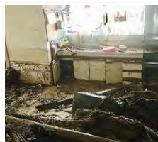
大量の泥や流木で埋めつくされた一階

避難所は家族ごとの仕切りというより、知り合い同士で部屋や区画で分けられていたので安心できました。また、失ったものは大きいですが品物は買うことが出来ます。人の優しさなどお金で買えないものを沢山得ることができました。あと自宅の庭で犬を飼っていたのですが、水に流されたのが怖かったです。家族から離れると不安がる状態です。避難所に連れていけなかった猫などに会いに、自宅に定期的に帰っていた被災者の方もいます。