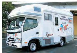
熊本地震で被災した人たちに薬を提供したモバイルファーマシー