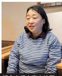
朝倉市杷木寒水地区

を始めたのは13日からでした。ボランティアの方の協力で最低限の生活ができるまでにはなりませんが、半年以上経った今もどこから手をつけようかという状態です。中学校に避難していましたが、お風呂は早い段階から自衛隊が用意してくれ、旅館が温泉を無料開放してくれたのも嬉しかったです。トイレ問題が一番大変で、役所からもらったビニールの簡易トイレを使用しました。年配の方は使い方