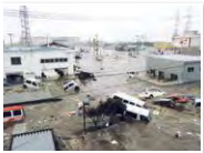
多賀城市の中心地の津波被害状況

多賀城市の最大震度は5強でしたが、市の1/3が津波で浸水。堤防が決壊して川からも海からも津波がくる、都市型津波の典型でした。避難所は人でこった返し、仕切りもなく決して理想的な状況ではなかったです。役所だけでは避難所運営ができないことも学び、震災後の防災訓練は地区単位で実施。コミュニティもできやすいし、要望の解決も市民目線でできます。また震災を教訓に分散備蓄にし、避難所ごとに倉庫を設置。備蓄の使い方を地区の方と共有し誰でも使えるようにしています。