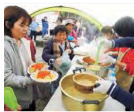
温かいものを食べるとみんな笑顔に