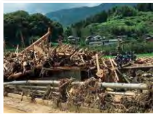
長時間猛烈な雨が降り続いた朝倉の被害状況

平成29年7月5日から6日にかけて、福岡県・大分県を中心とする九州北部で発生した九州北部豪雨。大きな被害を受けた福岡県朝倉市で、自宅を離れている最中に被災した2名の方に話を伺いました。