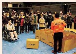
卒業生による活動風景

私が防災士になったきっかけは、地図を使って防災を考える「災害図上演習(DIG)」を体験し、防災に興味を持ったことです。地域や学校でDIGやクロスロードゲーム・非常持ち出し品ゲーム・災害食クッキングなどを楽しく体験し、防災を身近に感じてもらった時はうれしいです。「みんなで楽しく防災・減災」をモットーにこれからも活動したいと思います。