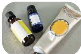
アロマや香り付ハンドクリーム