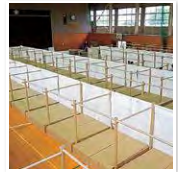
昼間は椅子としても重宝した段ボールベッド

仮設トイレを男女別にわけたり、洗濯機・乾燥機を設置するなど日々環境は整っていきましたが、避難生活が長期化すると疲れやストレスも溜まります。支援制度を利用して、1泊バス旅行に行ってもらい、その間に、避難所内の大掃除と毛布の入れ替えをしたり。避難所を出たあとも、大変な生活は続くと思っていたので少しでも元気に、笑顔で避難所から送り出したい