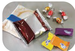
いつも食べている好きなおやつ