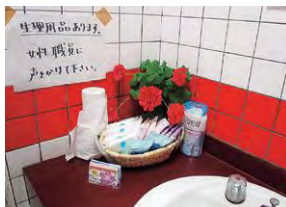
トイレに置かれた女性用品

被災者の女性が、気兼ねなく女性用品を手に入れることができるよう、女性トイレの手洗い場や個室の中に常備。