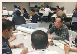
グループワークの風景