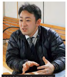
益城町 東無田地区