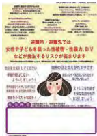
実際の防犯ポスター