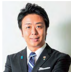
福岡市長 高島 宗一郎

身近に置いて、日常生活の中で防災を意識していただくとともに、避難生活に備えていただけたら幸いです。