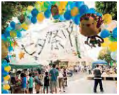
みんなで力を合わせて実施した七夕祭り