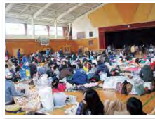
避難者であふれかえる学校体育館

行政でルール化せずみんなでジャッジ 1500人いる避難所に10食程度しか届かないものもあり、そのときは「皆さんで考えて分けてください」と渡すようにしました。そうすると上手く分けてくれる。だんだんと秩序が守られるようになり、避難所や地区ごとに防犯の見回りなども始まりました。住民の皆さんを信じることも重要な視点の一つで、大切なこと