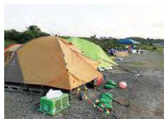
益城町でのテント避難の様子