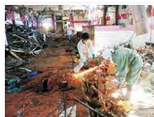
海岸沿いにあった観光物産館での、懸命な撤去作業

日に日に変わるやるべきこと 暖かくなるとにかく衛生面に気をつけようと、消毒液を撒き、大量発生したハエやウジ虫を徹底的に退治しました。病気が一番心配でしたね。窃盗も発生していて、自宅避難者に欲しいものを聞くと「金属バット」と言う方がいたのも衝撃でした。物資の受け取り方など知り合いだからこそ見たくない部分もあつたようですが、顔