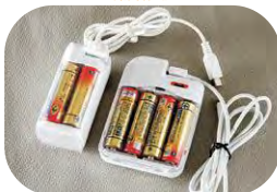
SNSで連絡できる！ スマホの充電バッテリー