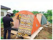
倒壊の危険性がない場所にテントを設置し、生活

地震で家が全壊。もともとアウトドアが好きでキャンプ用品を持ち合わせていたので、安全な場所ですべてテント避難を始めました。その後、僕たちの様子を見た近所の方から「テント避難をしたい」という声があり、SNSで物資の支援を依頼。屈次次第、希望する方の敷地にテントをはっていきました。最終的に70張りのテントを設営。公民館に集まってみんなで食事をするのもあったんですが、そのときに行政の重要な書類を掲示して、情報を共有していました。