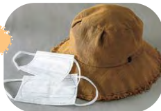
すっぴん対策で利用した マスク・帽子