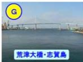
荒津大橋・志賀島

2階から階下に「せり」の様子をご覧ください AM3時～4時頃 (日・祝日休み、臨時休場あり)