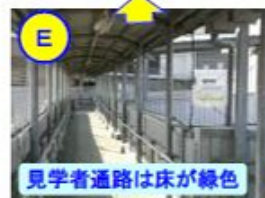
見学者通路は床が緑色