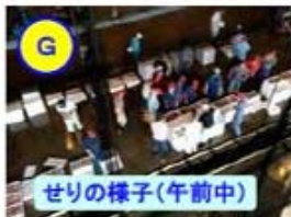
せりの様子(午前中)