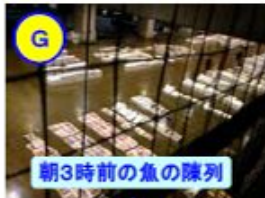
朝3時前の魚の陳列