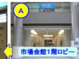
市場会館1階ロビー