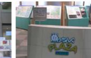
魚っちんぐプラザ