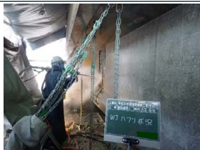
②【ウォータージェットではつりとり】