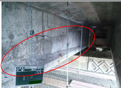
①【橋桁の側面の浮き】

よかトピア橋は海岸線から近く、満潮時にはかなり水面と近くなり、風が強く波が高いときには波しぶきが橋桁に掛かる状況となっています。このような環境により、塩分と水分が大量に供給され、鉄筋が腐食し、膨張してコンクリート表面に①写真のような「浮き」ができていました。このため②、③写真のようにウォータージェットでコンクリートをはつりとり、④写真のように鉄筋の錆を落として防錆剤を塗布した後に⑤写真のように塩分侵入の抑制効果が高い材料（モルタル）を吹付けて復旧しました。