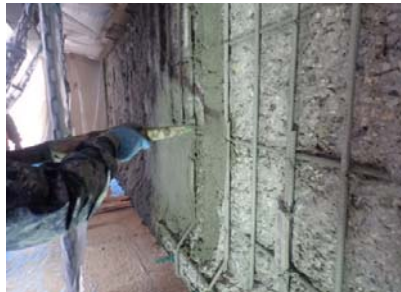
⑤【復旧(モルタル吹付)】