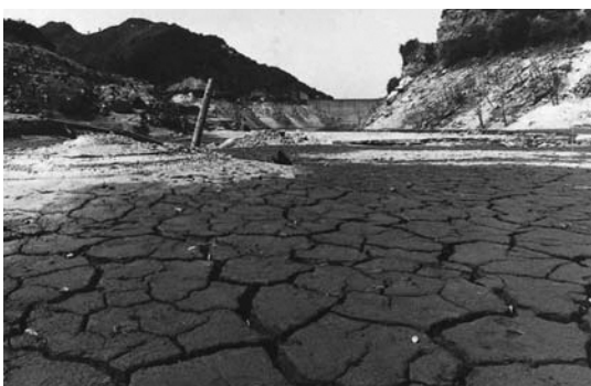
▲干上がった南畑ダム(那珂川市)