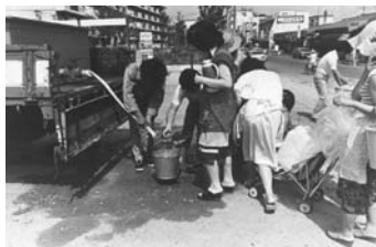
▲バケツに給水を受ける市民

福岡市は、昭和53(1978)年と平成6(1994)年に2度の大渇水に見舞われました。特に昭和53年は、6月1日から6月10日まで1日5時間しか、じゃ口から水が出ませんでした。