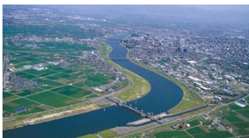
筑後川の筑後大堰▶

大きな河川がないなど水資源に恵まれていない福岡市は、使用している水のおよそ1/3を筑後川に頼っています。