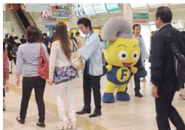
▲節水の日街頭キャンペーン

毎年、節水の日街頭キャンペーンを実施し、市民のみなさまに水の大切さを呼びかけています。