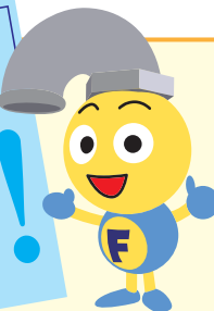
福岡市水道局マスコット フクちゃん