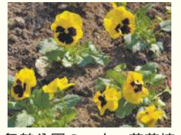
舞鶴公園の一人一花花壇

区の人口 201,835 人 (前月比 395 人増) (男 90,012 人 女 111,823 人) 世帯数 124,153 世帯 (前月比 308 世帯増) (令和元年11月1日現在推計)