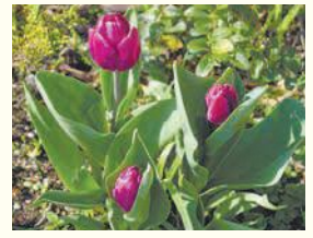
大濠公園のチューリップ

区の人口 199,725 人 (前月比 131 人増) (男 89,150 人 女 110,575 人) 世帯数 122,149 世帯 (前月比 98 世帯増) (平成31年3月1日現在推計)