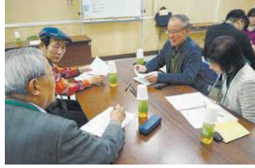
グループに分かれ、活動への思いや悩みを共有しました

中央区や城南区で現在活動中の団体と、これから活動を始めようとする団体を集めた交流会が2月15日に開催されました。中央区から5団体参加。中央区から5団体参加。中央区から5団体参加。