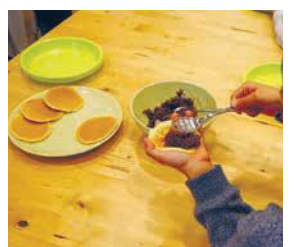
この日のおやつはどら焼き。あんをたっぷり載せて

もたちに遊び場を提供する「グランマキッチンカフェ」が第1・3水曜日の午後3時～6時半に開かれています。宿題をしたり、手作りのおやつを食べたり、小学生から高校生まで無料で利用できます。