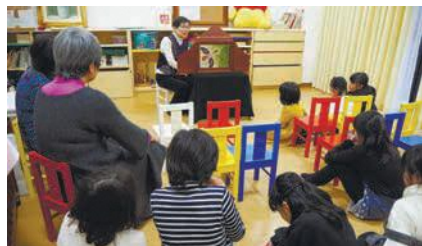
紙芝居や折り紙など、子どもたちは自由に遊んで過ごします

中央区や城南区で現在活動中の団体と、これから活動を始めようとする団体を集めた交流会が2月15日に開催されました。中央区から5団体参加。中央区から5団体参加。中央区から5団体参加。