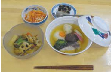
左上から時計回りに柿なます、黒豆ゼリー、博多雑煮、がめ煮

㊟1月7日(火)午前9時から電話で区地域保健福祉課(☎718-1110 ㊟734-1690)へ。