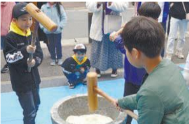
タイミングを合わせて、上手につくことができました

12月2日に、当仁校区食生活改善推進員協議会の主催で、郷土料理教室が開催されました。同校