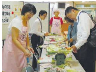
一日に必要な野菜350gを量ってみませんか

★測定・体験・展示コーナー 筋肉量・体脂肪測定・肺年齢測定・骨密度測定などを行います。また介護予防に効果的な「よかトレ」体操の体験も実施します。