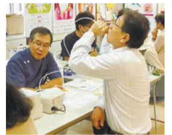
息を吹き掛けて口臭チェック