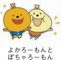
よかろーもんとぼちゃろーもん

★健康弁当の販売 区食生活改善推進員協議会の皆さんが調理した健康弁当(400円)を先着150食分販売します。食券は午前10時からあいいふ1階ロビーで購入してください。食事は午前11時半から午後1時まで7階で取ることができます。