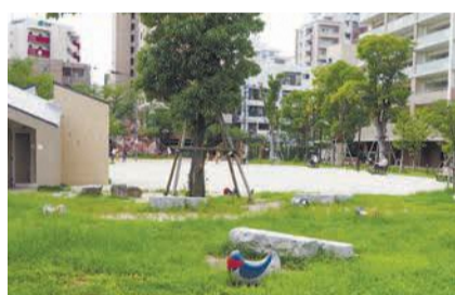
さまざまな人が訪れる憩いの空間