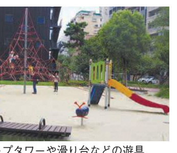
ロープタワーや滑り台などの遊具

ス跡地の一部である約3000平方メートルの敷地内に子ども用遊具や、多目的広場、健康遊具などさまざまな活動ができる公園になりました。