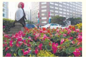
天神地蔵と一人一花花壇

区の人口 201,428人 (前月比174人増) (男89,841人 女111,587人) 世帯数 123,882世帯 (前月比107世帯増) (令和元年8月1日現在推計)