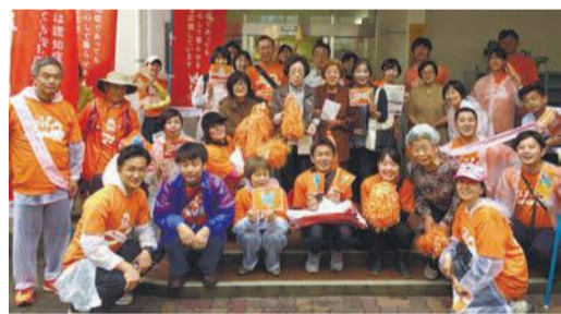
オレンジ色のシャツやグッズを身に付けて区内各所を回ります

所どなたでも参加できます。オレンジ色の物を身に付けて来てください。沿道での応援のみも大歓迎です。※詳しいルートや時間を知りたい人は問い合わせ先へ。