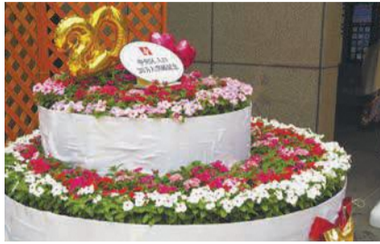
おもてなしの心で作ったフラワーケーキ