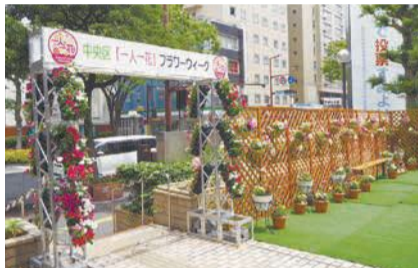
区役所玄関前広場も色鮮やかに