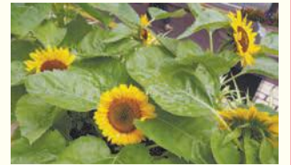
区役所前のひまわり

区の人口 201,161 人 (前月比 156 人増) (男 89,716 人 女 111,445 人) 世帯数 123,695 世帯 (前月比 93 世帯増) (令和元年6月1日現在推計)