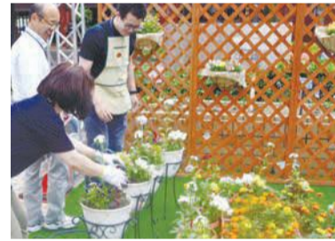
花の配置にこだわりました

一人一花運動は市民・企業・行政一人ひとりが花と緑を育て、市を花と緑でいっぱいにする取り組みです。区はおもてなしの心を形にし、「また行きたい」と感じてもらえる中央区を目指し、6月3日～7日に中央区「一人一花」フラワーウィークを開催しました。今年の4月に中央区の人口が20万人を突破したことや、G20福岡財務大臣・中央銀行総裁会議開催を記念し、大きなフラワーケーキやハンギングバスケットなどを職員が手作りで制作。慣れない日草などの花の種の配布も好評でした。