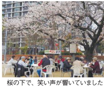
桜の下で、笑い声が響いていました

力 生後7カ月頃の赤ちゃんがいる家庭を訪問し、地域の子育て情報を提供する「こんには赤ちゃん訪問事業」など、行政の事業に協力しています。