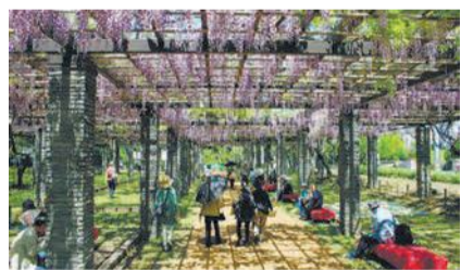
今年も「藤まつり」が開催され多くの人が訪れました

また、昭和の時代に整備されている陸上競技場などでスポーツを楽しむことができます。ウメ、ボタン、シャクヤクなど季節の花々や緑もあり、歴史