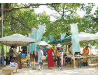
みどりのまちマルシェには、体や環境に優しい食べ物や商品が集まります

代理人の証明請求には委任状を 市税に関する証明を代理人が請求する場合は、家族でも委任状が必要です。請求の際には代理人の本人確認書類(運転免許証など)も併せてお持ちください。☎718-1049 ☎714-4231