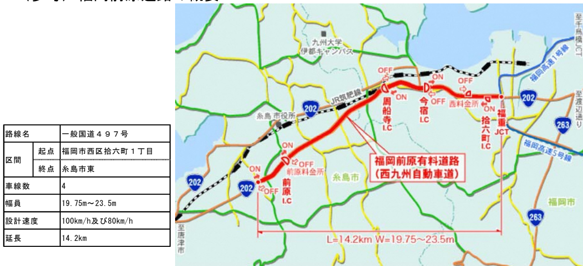
「福岡県道路公社HP」を基に作成