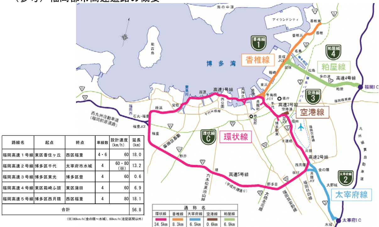
「ふくきたネットワーク（福岡北九州高速道路の概要）」を基に作成